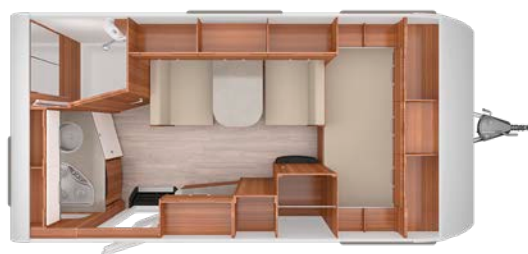
TURIANO 420 QD/F