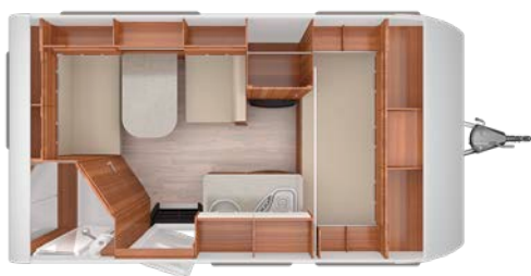
TURIANO 390 QD/F

*Pour les caravanes de la marque TURIANO, dans le cadre des conditions de garantie de livraison du véhicule, nous vous offrons une garantie étanchéité de 10 ans ainsi qu'une garantie constructeur de 24 mois auprès de votre concessionnaire TURIANO.