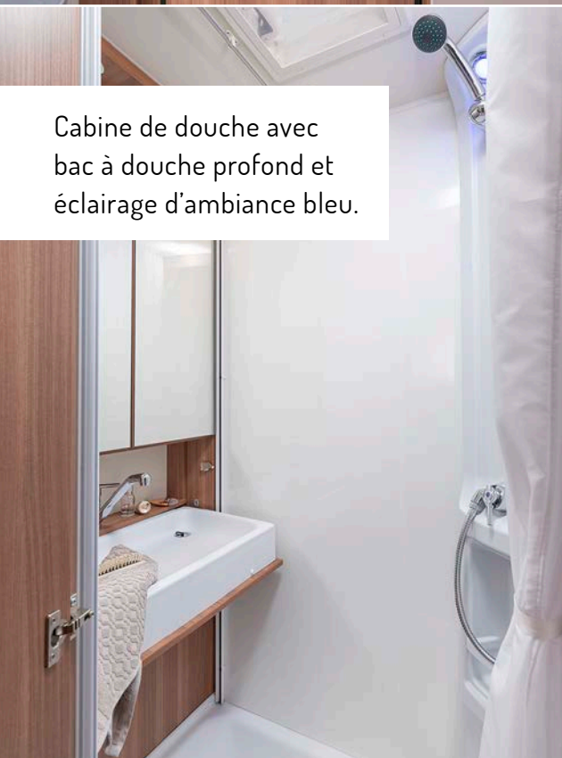
Cabine de douche avec bac à douche profond et éclairage d'ambiance bleu.